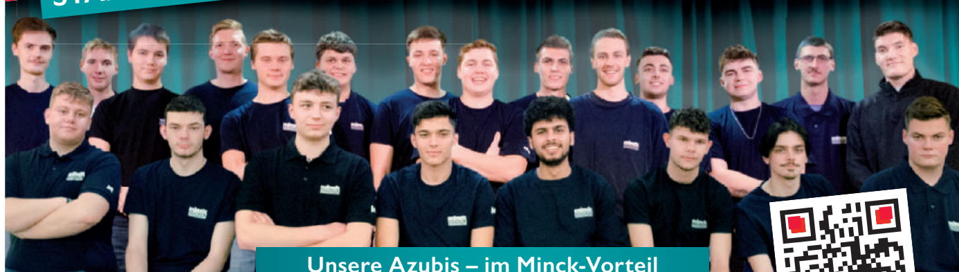
Unsere Azubis – im Minck-Vorteil